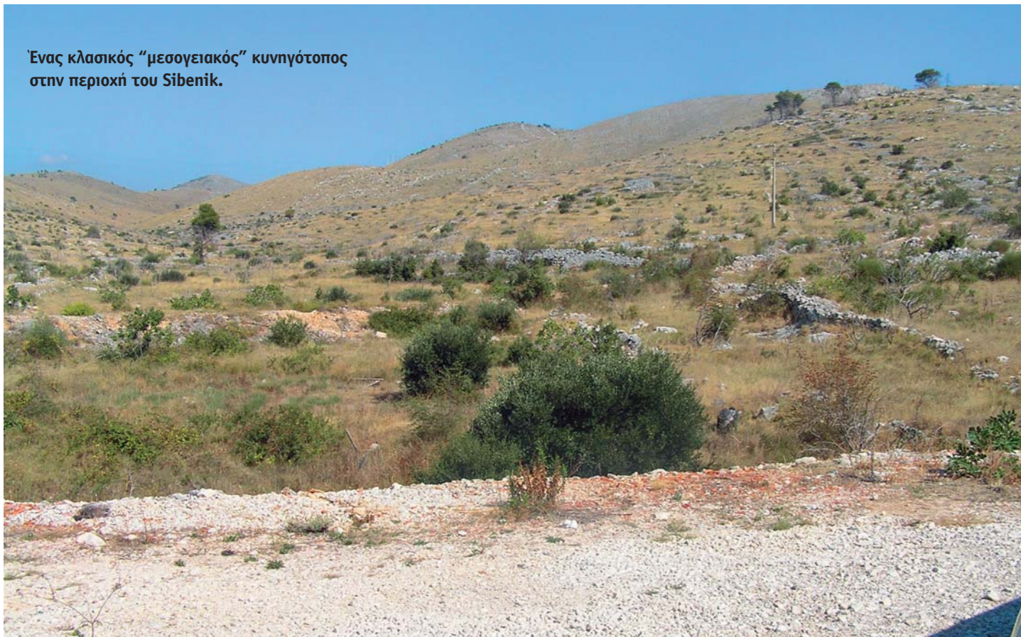
Ένας κλασικός “μεσογειακός” κυνηγότοπος στην περιοχή του Sibenić.

να φανεί οπτικά, αλλά θα μπορούσαν να το κρίνουν μόνο τα σκυλιά μας αν τα είχαμε πάρει μαζί μας εκεί, όμως η μορφολογία των εδαφών εκεί και η θερμοκρασία, δεν διέφερε σχεδόν καθόλου από τα ελληνικά πετρώδη βουνά. Το γεγονός βέβαια της άμεσης προσαρμογής των σκυλιών, που πήραμε μαζί μας στη συνέχεια, στα Ελληνικά κυνηγοτόπια, φανερώνει και την καταλληλότητα των ιχνηλατών της Ίστρια στα εδάφη μας και στις καιρικές συνθήκες εδώ.